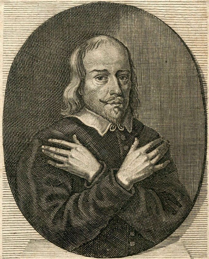
Jacob Böhme, Philosophus Teutonicus.